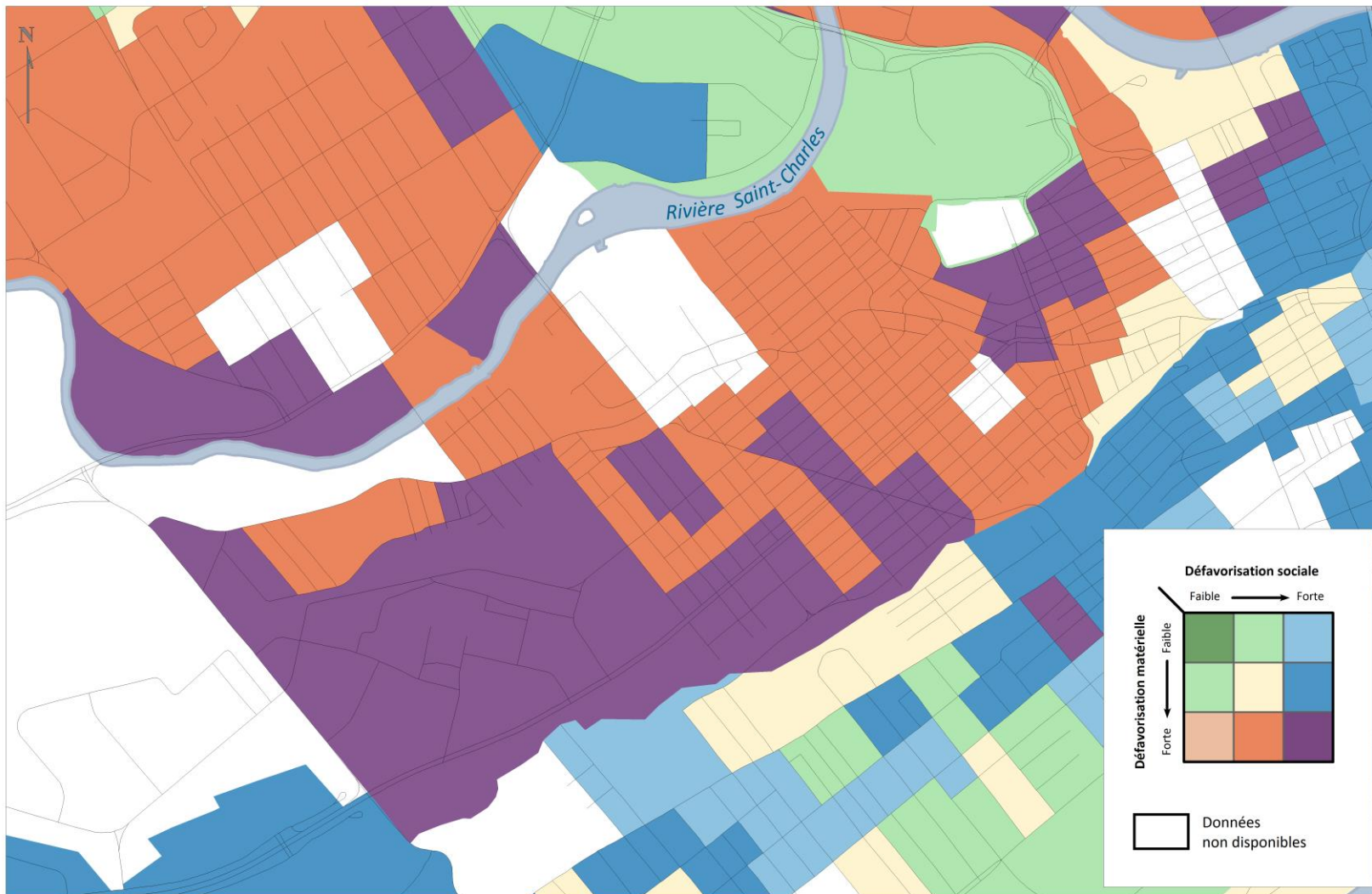
INDICE DE LA DÉFAVORISATION MATÉRIELLE ET SOCIALE - QUARTIER SAINT-SAUVEUR