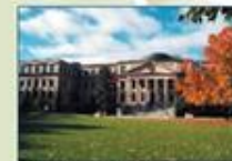
Université d'Ottawa (Ontario)

uOttawa L'Université canadienne Canada's university