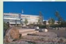
Collège Boréal (Sudbury, Ontario)