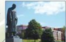
Université de Moncton (Nouveau-Brunswick)

UNIVERSITÉ DE MONCTON ÉDWARDEN MONCTON SHERBROOKE