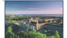
Université Sainte-Anne (Nouvelle-Écosse)