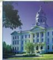
Collège universitaire de Saint-Boniface (Manitoba)