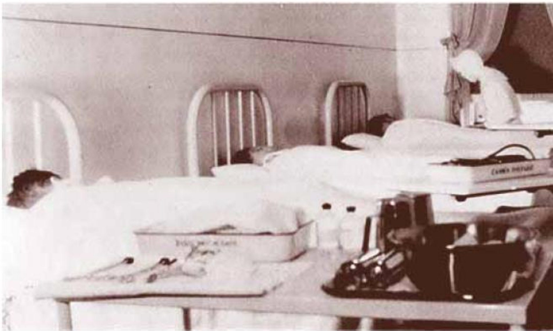
En 1950 étaient organisés les locaux destinés aux cures insuliniques.