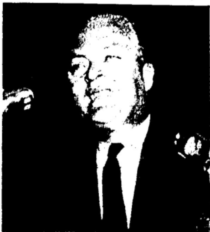
... sous le régime...

Le chalet de golf Interrogi au sujet de l'affaire du chalet de golf de St-Georges de Beauport, M. Lesage a déclaré: Voir page 2 — L'enquête sur